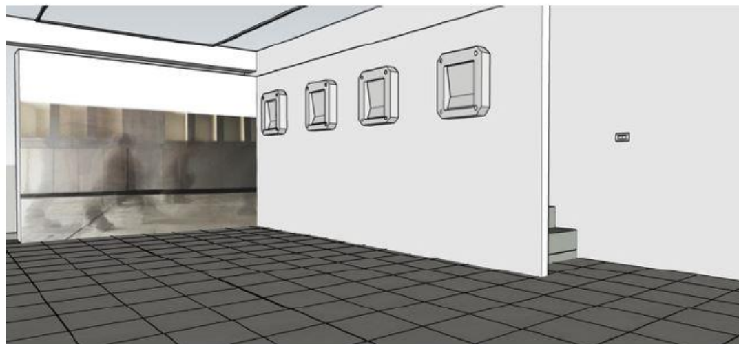
圖五：展場其他角度模擬圖。